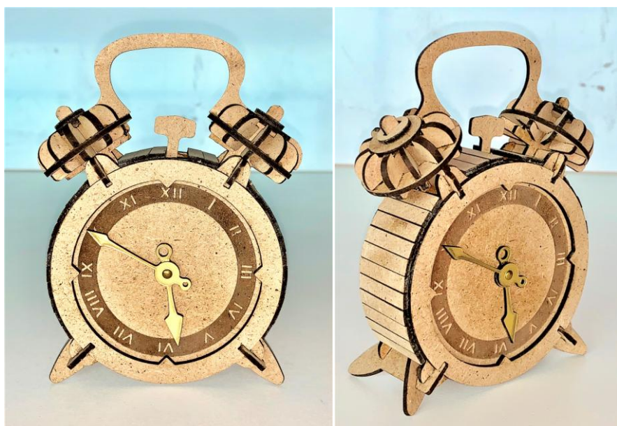
Réveil découpé avec une machine laser AGATHE 5030 ARKETYPE

Et une puissance laser de 15% uniquement pour marquer.