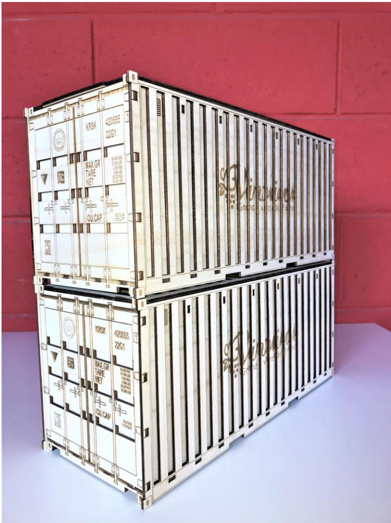
Coffret bouteille de vin découpé avec une machine laser JADE 6090 ARKETYPE