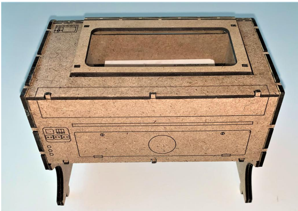
Coffret carte de visite découpé avec une machine laser AGATHE 5030 ARKETYPE